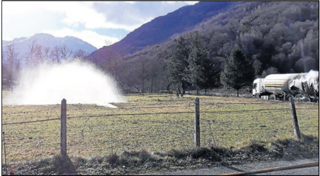
Un jet d'eau empêchait la propagation du gaz déversé (dans le sol, la fumée devant l'eau) par le camion brûlé (à droite).

H.C. | LLEIDA | Le Conseil Général du Val d'Aran et la mairie de Vielha ont convenus hier d'avertir du volume élevé du trafic des camions par la N-230 et réclamé qu'il soit réduit, d'autant que, aux déficiences de cette route (dans plusieurs tronçons, le passage de deux camions de sens contraire est difficile, pour exemple, entre l'entrée nord du tunnel et Vielha) s'ajoute le fait que c'est une route internationale très utilisée pour le transport de marchandises. Le Syndic du Val d'Aran, Carlos Barrera, a estimé à 560 le