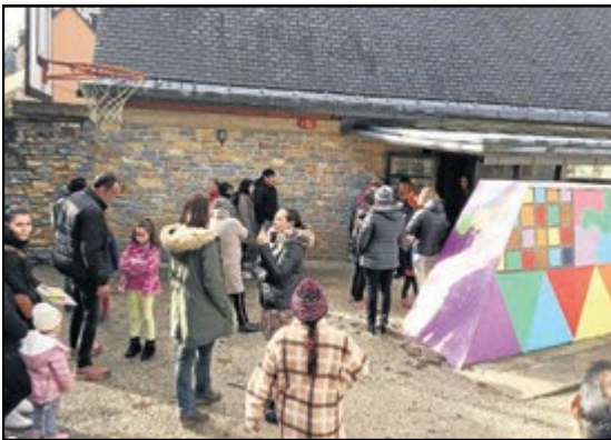
Parents et élèves vers midi avec la situation déjà normalisée.

nombre de camions traversant chaque jour le tunnel de Vielha dont plusieurs dizaines utilisent l'ancienne galerie, habilitée en 2011 pour le transport de matières dangereuses. Les derniers chiffres pointent une trentaine de camions de matières dangereuses qui entrent tous les jours dans le Val par ce passage.